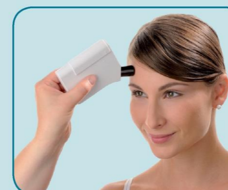
vsebnost maščob (sebum)