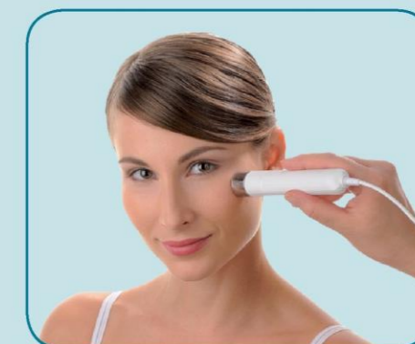
melanin in eritem ter potrebna zaščita pred soncem